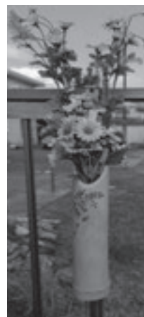
12月に取り換え後の花挿し