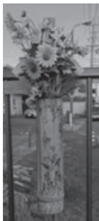
設置後3年の花挿し