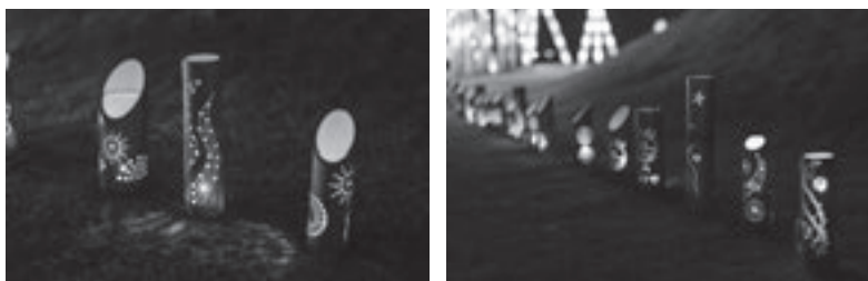
過去に当事業で作製された作品の展示の様子（竹あかりの展示inふれあいパーク）

竹あかりとは、竹に穴をあける等の加工をし、光源を入れることで幻想的な光を放つ作品です。例年好評の「うちでつくろう！竹あかり」を今年度も実施します！竹あかりを作るために必要な材料および工具等一式を希望者に貸し出しますので、自分だけの竹あかりづくりにぜひチャレンジして下さい！完成した作品はご自宅等に飾ってお楽しみ下さい。また、年度内に町内で竹あかりを展示する企画を開催する際、可能であれば完成した作品をお貸しいただきますようお願いいたします（詳細未定。ご協力いただける方には別途ご連絡いたします）。