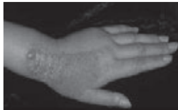
参照：東邦大学メディカルレポート