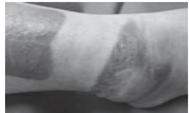
参照：光線過敏症（佐藤吉昭編）