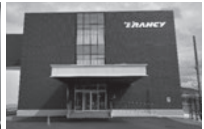
（避難施設「事務所棟」）