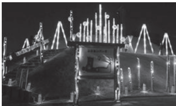
竹あかりの展示イメージ (画像は昨年度のふれあいパークでの展示)