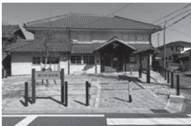
改修後の朝日町資料館

※当事業はPEEK-A-BAMBOO！あさひ竹プロジェクトの一環としてみえ森と緑の県民税市町交付金を活用して実施しています。