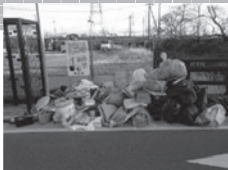
▲ルールが守られていない粗大ごみ収集後の写真

ルールが守られていないごみは収集しません。 収集されなかったごみは、出した方が持ち帰ってください。