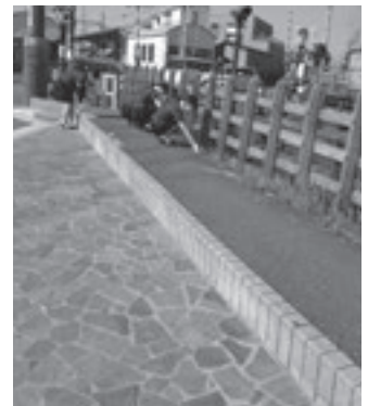
<三十三銀行朝日支店の清掃活動写真>