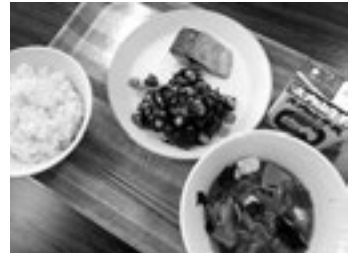
原木しいたけとあさひのお米を使ったメニュー