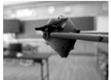
肉厚のある原木しいたけ