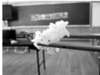
もちもち感のあるあさひのお米 (品種：結びの神)