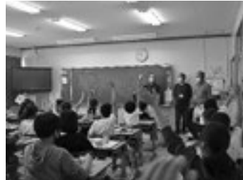
生産者を交えた給食の様子