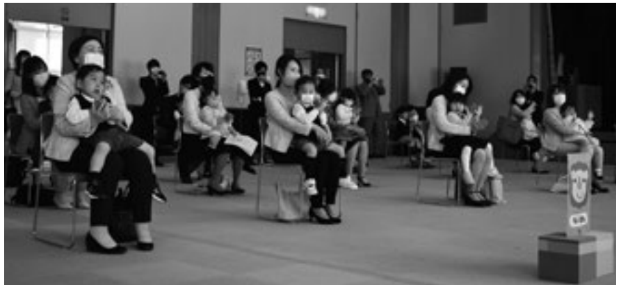
(手遊びをする園児)

4月5日(月)、7日(水)あさひ園及び保健福祉センターにて、入園式が行われ、新たに0~2歳児33名、3~5歳児56名が入園しました。これから始まる新生活に期待と希望で胸を膨らませながら、緊張した面持ちで入園式に臨んでいました。