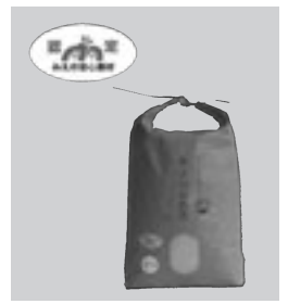
「みえの安心食材」 認定コシヒカリ(精白米)5kg