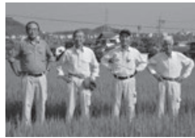
ライスファーム・アグリ朝日の皆さん

それぞれの個性を味わってください。重いお米は買って持ち帰るのも一苦労ですが、アグリ朝日さんのお米は町内であれば指定の場所まで無料で配達していただけます。令和初の新米をぜひお試しください!