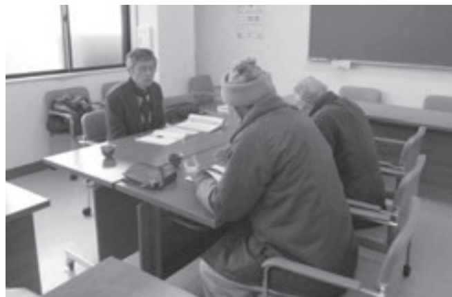
（昔ばなし懇談会の様子）