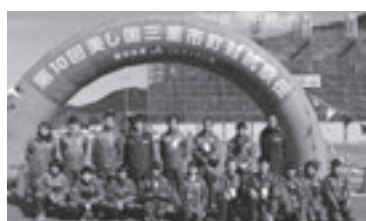
朝日町代表チーム