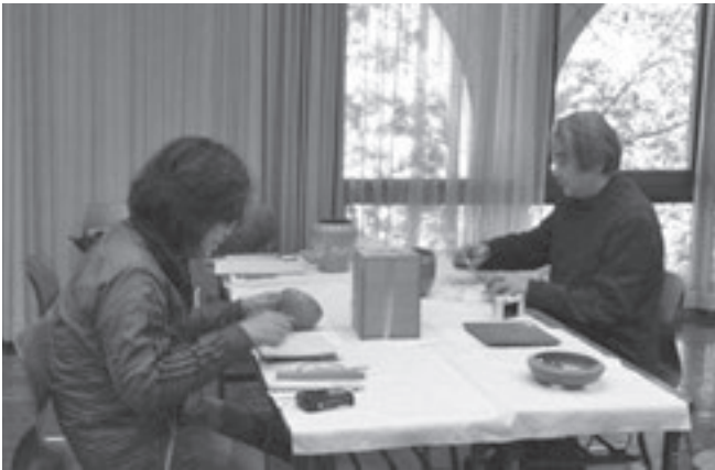
（萬古焼調査の様子）

1月11日（水）、12日（木）、19日（木）、23日（月）、25日（水）、26日（木）、30日（月）、2月2日（木）、3日（金）、8日（水）神宮徴古館、愛知県埋蔵文化財センター、四日市市立博物館他にて資料調査及び計測調査を実施しました。