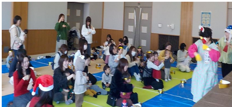
リアルプリンちゃん や さかなクンと一緒に 『Bling Bang Bang Born』をおどったね

2025年も ふれあい広場に あそびに来てくださいね 子育て支援センター職員一同