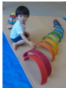
8月の ふれあい広場