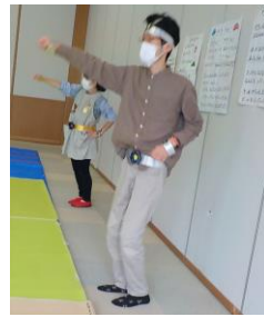
パパもダンスに参加