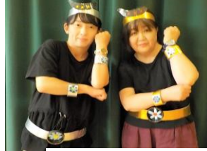
秋の体操 「小さなヒーロー」