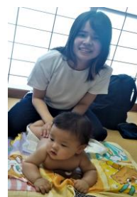
6月のベビー マッサージの様子