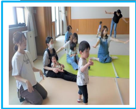
6月の体操 『おばけのあかちゃん』