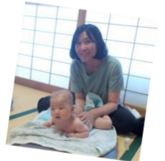
6月のベビーマッサージの様子