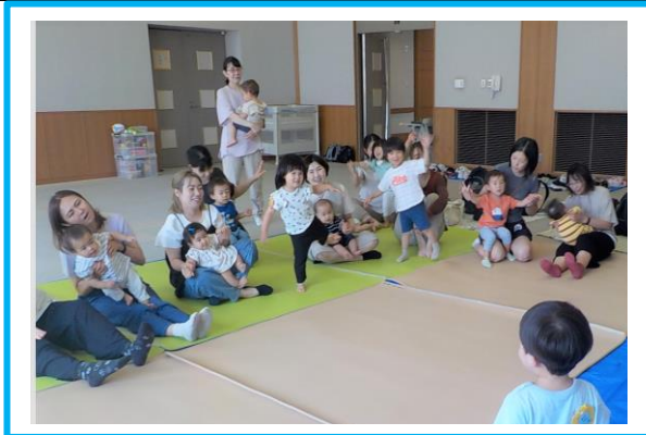
6月のふれあい広場の様子