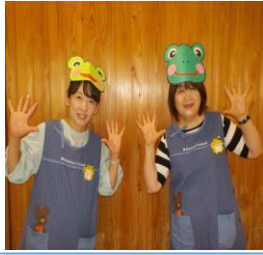
参加者の皆さんで『カエルの合唱』を輪唱しました

朝日町在住の未就園児さんと保護者さんの参加が可能です。ホール1・ホール2の日はご夫婦での参加も出来ます