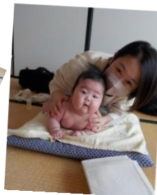
3月のベビーマッサージの様子

持ち物 長方形バスタオル・替えオムツ2枚・おしりふき・使用済みオムツ用のビニール袋・大人用飲物・スタイ・赤ちゃん着替え・ガーゼハンカチ(赤ちゃんのお口ふき)大人マスク・大人スカート以外の服装