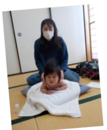
11月のマッサージの様子