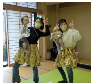
2月: 鬼のパンツをはいたママ

持ち物 大人は 不織布マスク着用 、飲み物(大人用と 子ども用)、ティッシュ、替えオムツ、おしりふき、使用済 みオムツ用ビニール袋、タオル、替えスタイ、(ネンネ期の 赤ちゃんは敷き用バスタオル・掛け毛布、授乳ケープ)