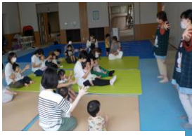
手あそび(月替わり)