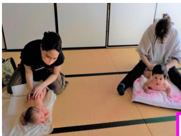
※上のお子さんの託児あります