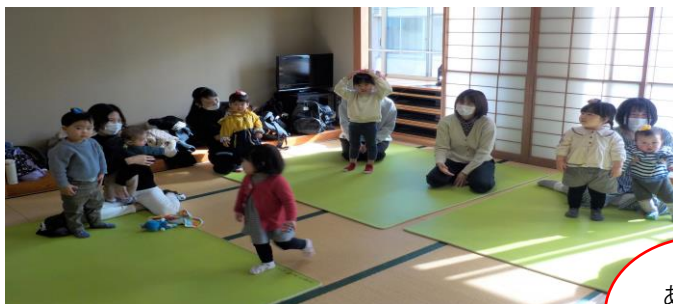
お手玉でわらべうた