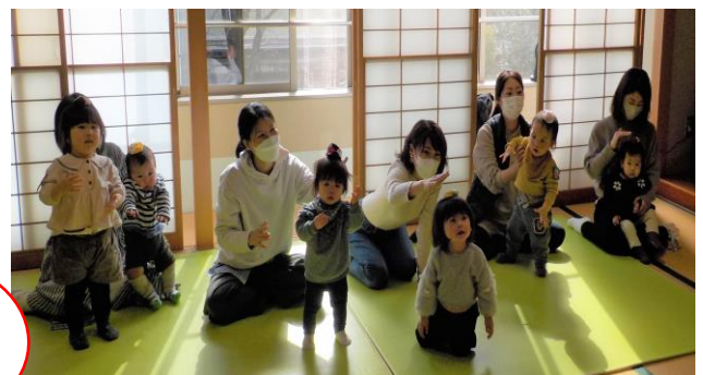
あたまに のせたよ