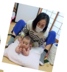
12月のマッサージの様子