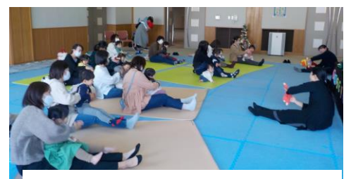
親子ふれあいあそび 『ジングルベル』