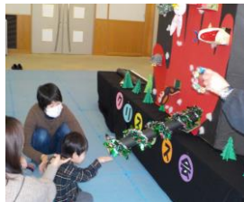
トンネルからプレゼント