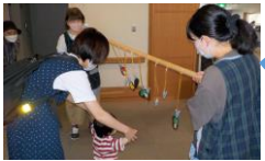
参加プレゼント(月替わり)