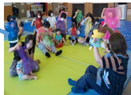
親子わらべうた(月替わり)