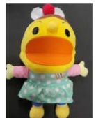
あまのプリンちゃん

2024 年も ふれあい広場に 遊びに来てくださいね 子育て支援センター職員一同