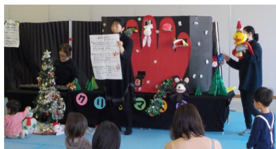
クリスマスのうた