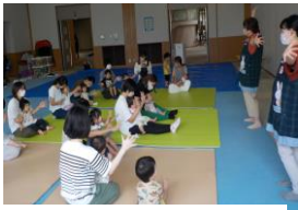
手あそび(月替わり)