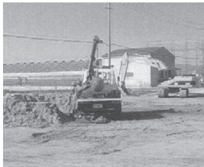
自衛隊による撤去作業