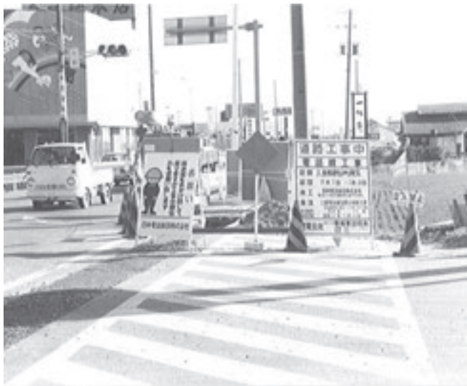
国道1号小向交差点