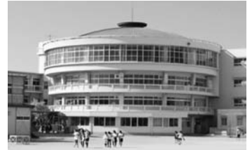
(朝日小学校円形校舎)

昭和30年代の小学校校舎の時代特色をあらわした建物で、再現することが容易でないものとして国の登録文化財に登録されることになりました。