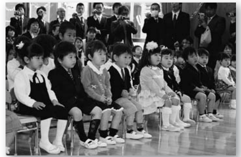
(人形劇を観る園児)