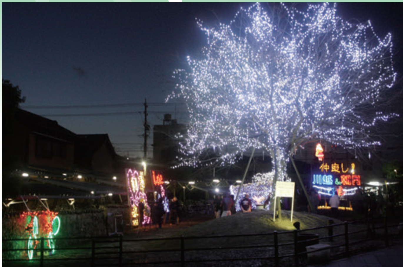
(ポケットパーク内イルミネーション)

総人口：9,932人 (+5) 男：4,970人 (-1) 女：4,962人 (+6) 世帯数：3,628世帯 (-5) (平成24年11月末現在)