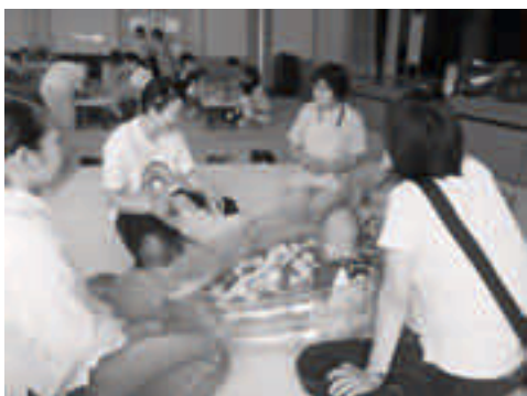
ファミサポのことを色々聞いたよ♪