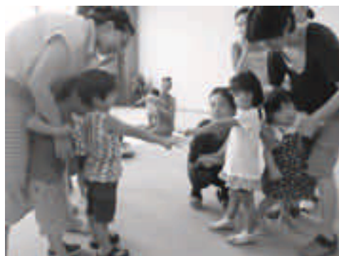
☆じゃんけん列車をしたよ☆