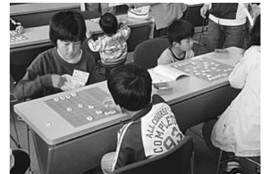
<学童保育所の子供たち>