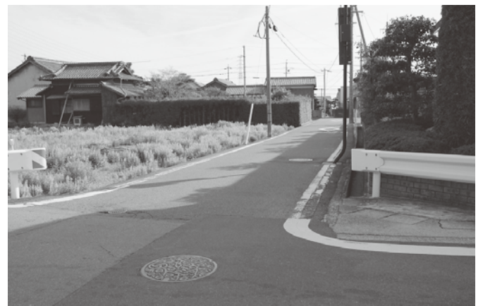
▲拡幅予定の町道1-57号線(繩生地内)