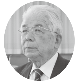
渡邊 仁 議員