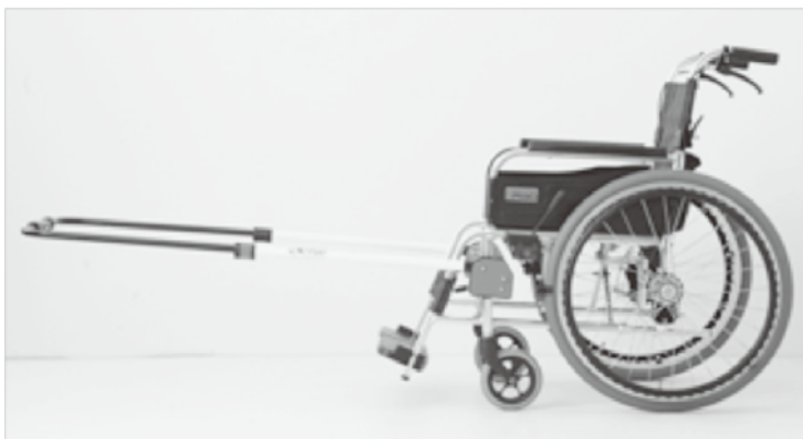
けん引式 車いす補助装置 JINRIKI®

町長 あさひ園、小中学校に対しては必要に応じて器具を設置し、他の公共施設に対しては、車いすの設置状況により設置を検討します。設置には県の補助金を利用したいと考えます。