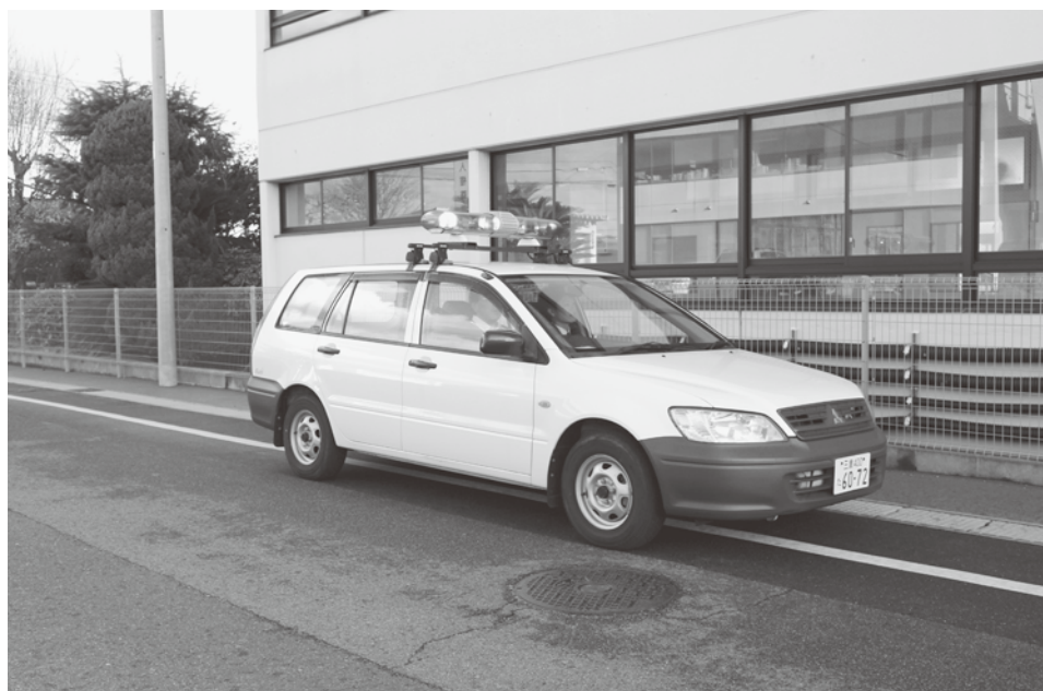
▲青色回転灯装備車による地域パトロール

議員 現在朝日町では各種団体が、地域パトロールなどの活動をしています。役場が防犯関係のコーディネーターとして、情報を共有できるような仕組みを検討する考えはありませんか。 町長 朝日・川越交番に連絡協議会という組織が設置されています。こうした組織を通じ、警察機関を中心に連携を図ることにより、一元的な体制で情報共有と防犯への取り組みを行っていくことができるかと考えています。