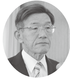
野呂 徹 議員