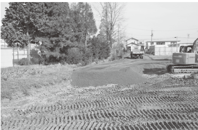
▲造成中の小学校体育館及びプール