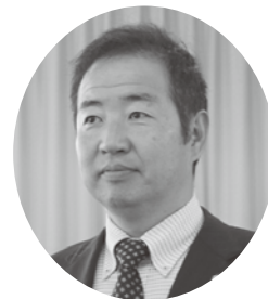
星野 嘉寛 議員