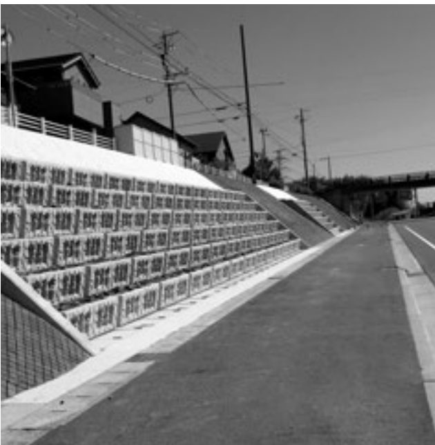
▲復旧工事が完了した白梅法面

5月28日に、クリーンな町を目指し、ごみゼロ運動を実施しました。約2100人の参加いただきました町民の皆様にお礼申し上げます。今後ともご支援ご協力をお願いします。