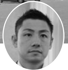
清 将人 議員