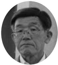
野呂 徹 議員