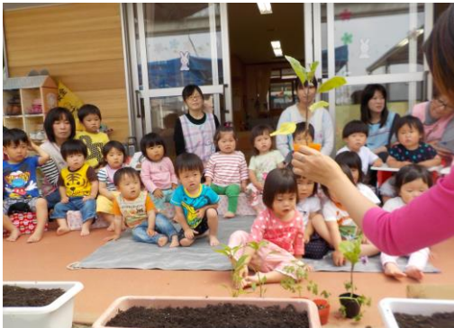
野菜の苗植え ピーマンだよ！ じっと見入って、興味津々の様子でした。