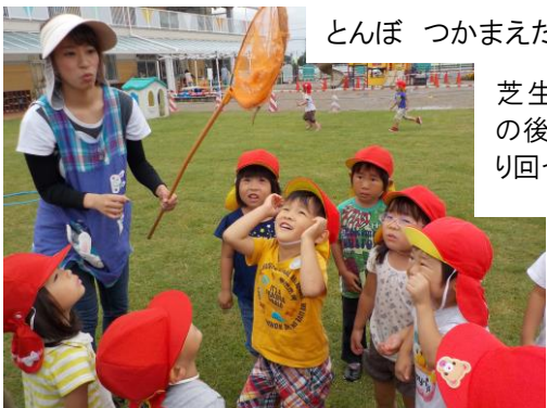
とんぼ つかまえたよ～