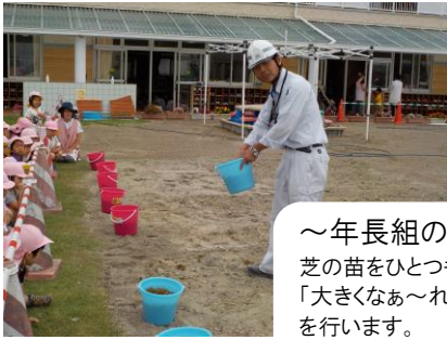
～年長組の植芝祭～ 芝の苗をひとつもらって、 「大きなあ～れ！」と芝植え を行います。