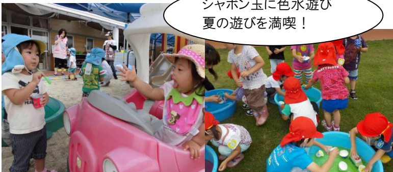
シャボン玉に色水遊び 夏の遊びを満喫！