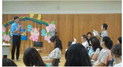
「魚を食べると、人と海が元気になる話～おいしく気楽な食べ方～」の演題でお話いただきました。