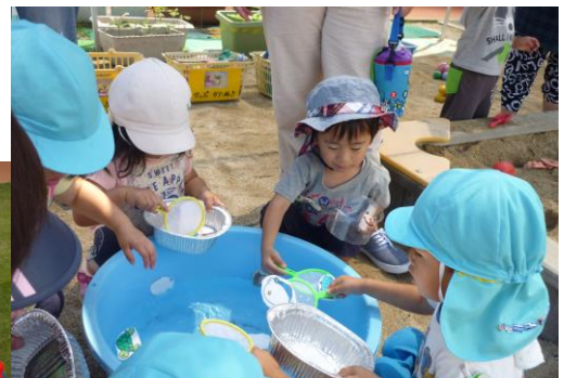
子育て支援のお友達といっしょに遊びました。 魚すくいに夢中です。