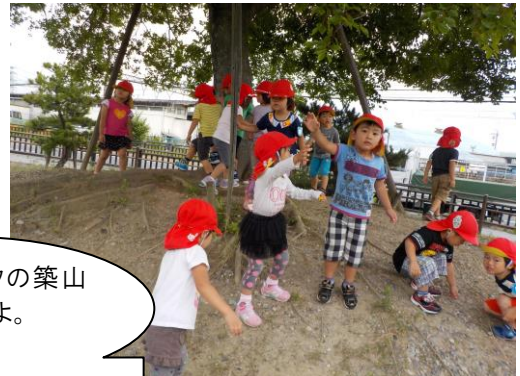
ポケットパークの築山 上まで登れたよ。 「やっほー」