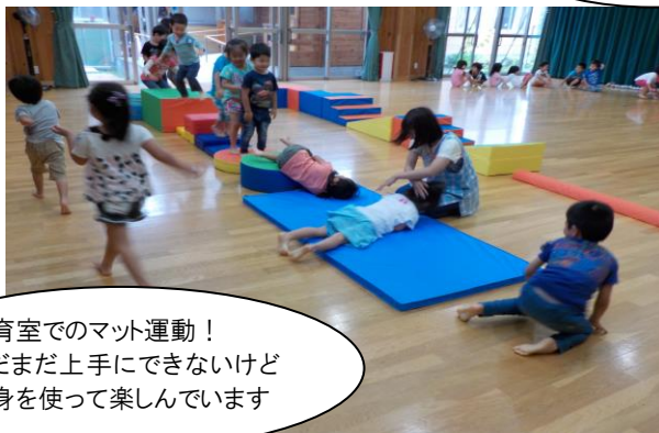
保育室でのマット運動！ まだまだ上手にできないけど 全身を使って楽しんでいます