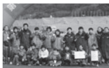
朝日町代表チーム