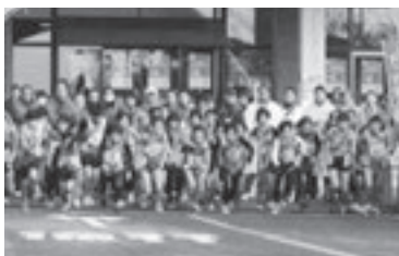
スタートする各市町選手

朝日町の皆様からご声援を頂き、誠にありがとうございました！選手の皆様、本当にお疲れ様でした！