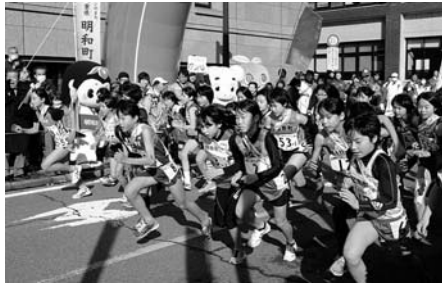
（一斉にスタートする各市町選手）