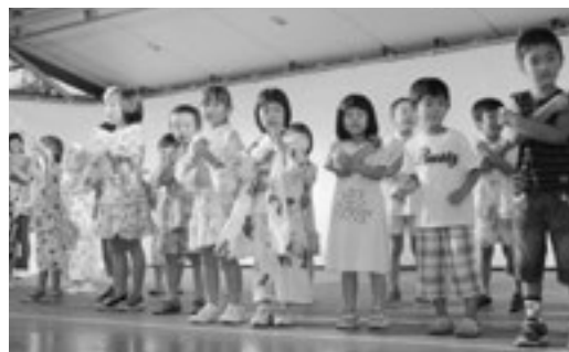
(園児パフォーマンスの様子)

8月18日(土)、東芝三重工場野球場にて東芝三重夏まつり2012が開催され、あさひ園の園児による盆踊りが披露されました。あいにくの雨でしたが、浴衣を着た園児たちが元気いっぱい踊って、会場を盛り上げてくれました。