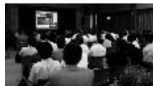
(講演に聞き入る参加者)

「平成の大合併」の検証や小規模自治体のあり方などについて意見交換が行われ、政府に市町の役割と財源の保障を求めるアピールを選択して閉幕しました。