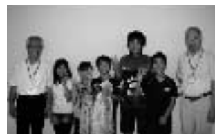
(平和の祈りがこもった折鶴)

我が国は世界で唯一の被爆国であり、広島や長崎のような惨禍を二度と繰り返さないように、原爆の恐ろしさや戦争の悲惨さをより多くの人々が理解し、次世代へ伝えていくことが重要だと考えます。