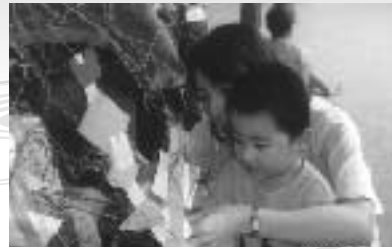
七夕の歌を歌いました♪