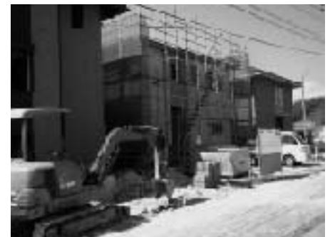
(住宅建設促進奨励事業)