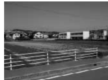
(幼保一体化施設建設予定地)