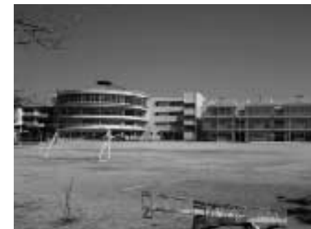
(教室不足が見込まれる小学校)