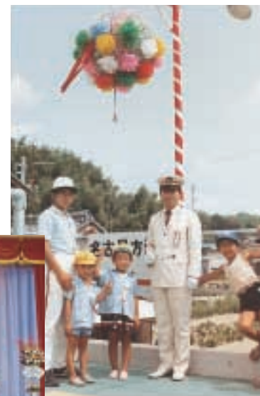
▲国鉄朝日駅開通 (昭和58年8月)