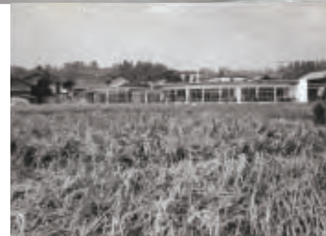
南保育園完成(昭和43年)▶