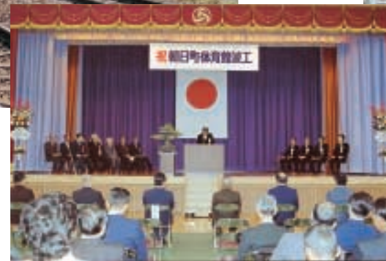
▲体育館竣工 (昭和57年3月)