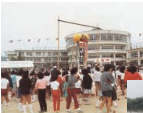
▲町制施行30周年記念町民運動会 (昭和59年10月)