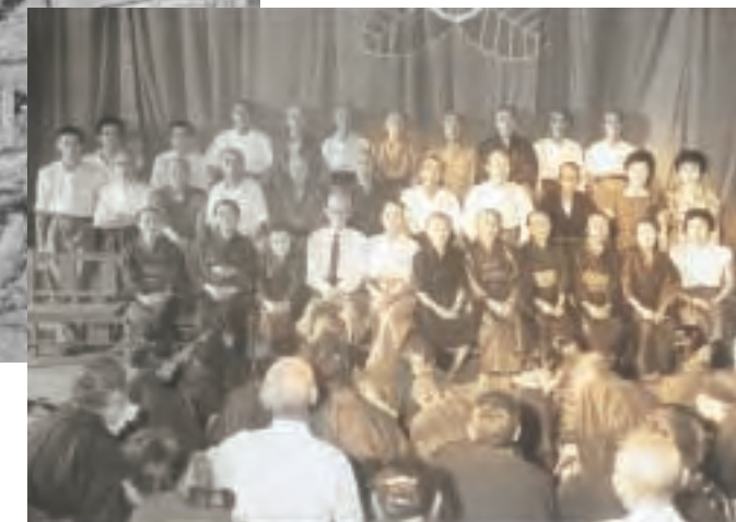
▲敬老会 町長を囲んでの記念撮影(昭和34年)