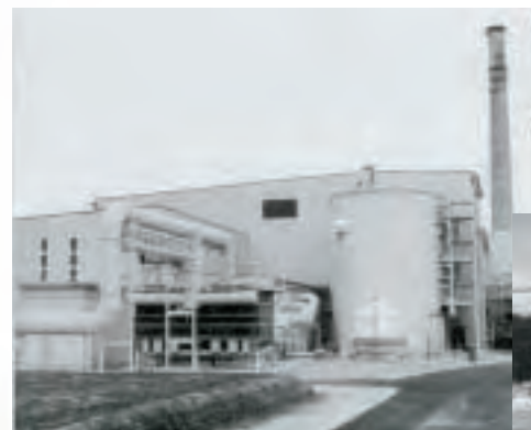
▲朝日町・川越町組合立環境クリーンセンター完成(昭和63年)