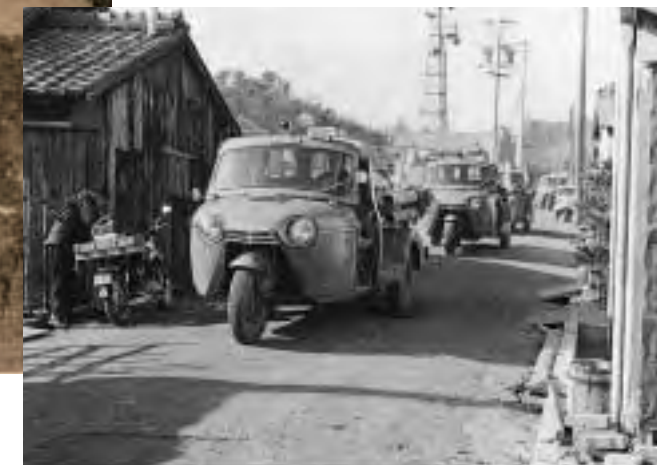
▲消防パレード(昭和36年)