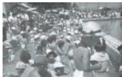
▲小学校プール竣工(昭和31年)