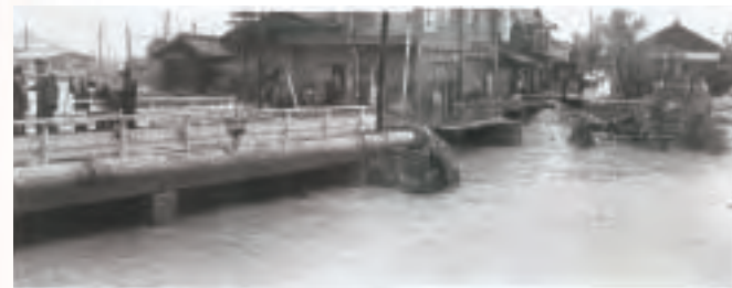
▲台風災害(昭和46年7月)