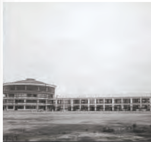
▲小学校完成(昭和37年)