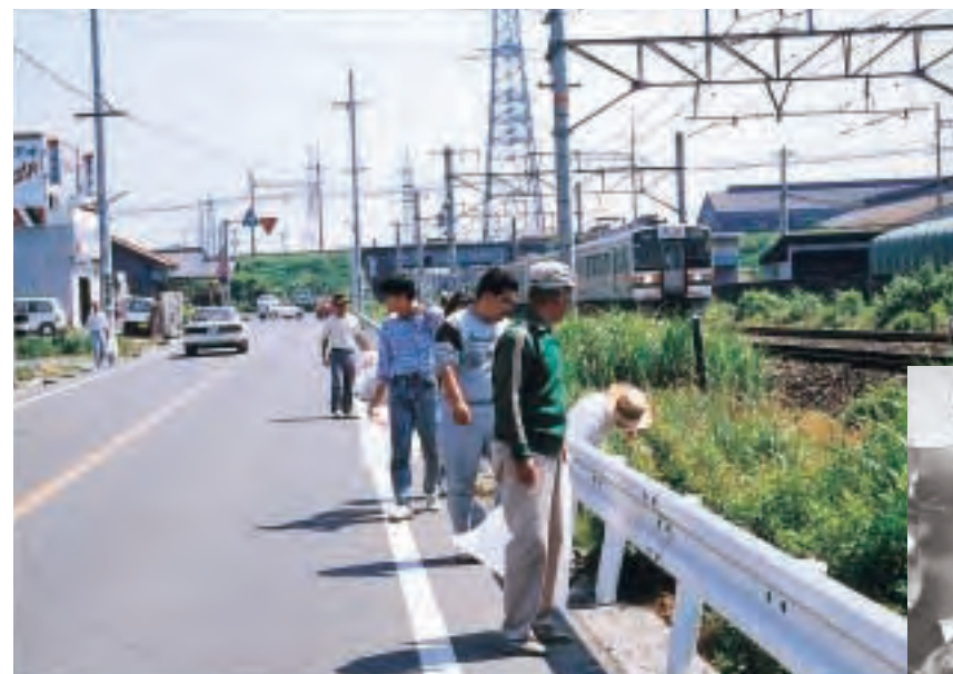
▲ゴミゼロ運動(平成2年)