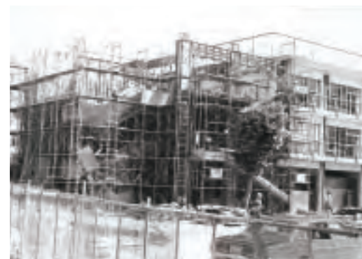
▲小学校西角形校舎増築着工(昭和51年)