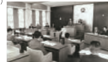
▲議会定例会(昭和42年)