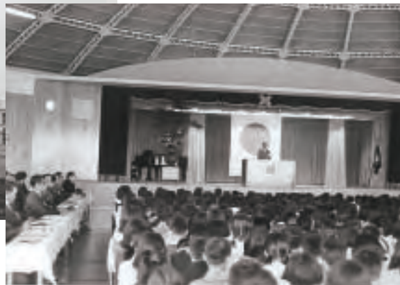
▲円形校舎4階ホール(昭和37年)