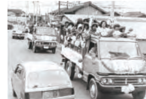
▲交通少年団結成式(昭和52年)