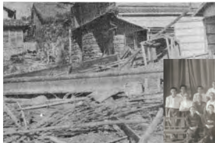
▲伊勢湾台風の被害(昭和34年)