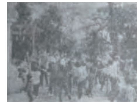
▲節分行事の柿子供会(昭和44年)