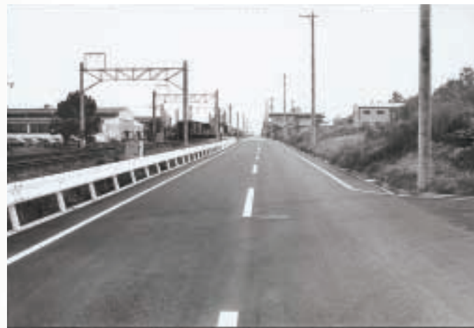
▲県道蒔田朝日線完了 (昭和55年7月)