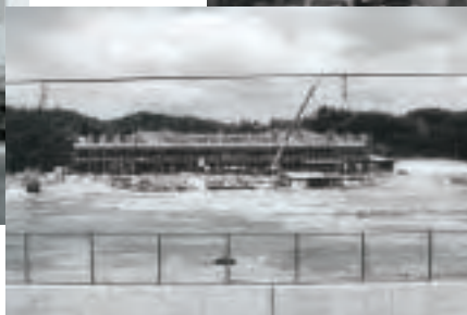
中学校建設現場(平成元年)