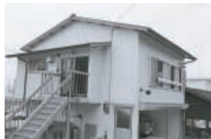
▲朝日ヶ丘公民館完成 (昭和56年4月)