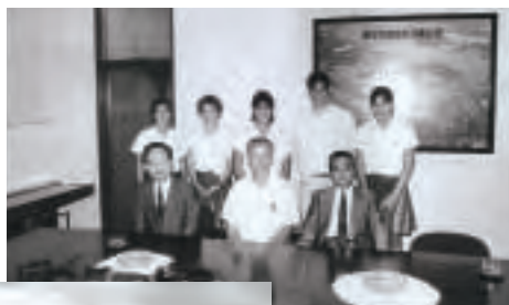
▲川越高校留学生(平成元年)