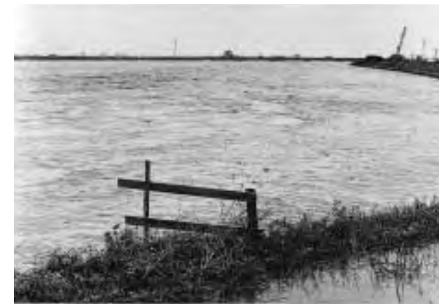
▲集中豪雨による被害(昭和49年)