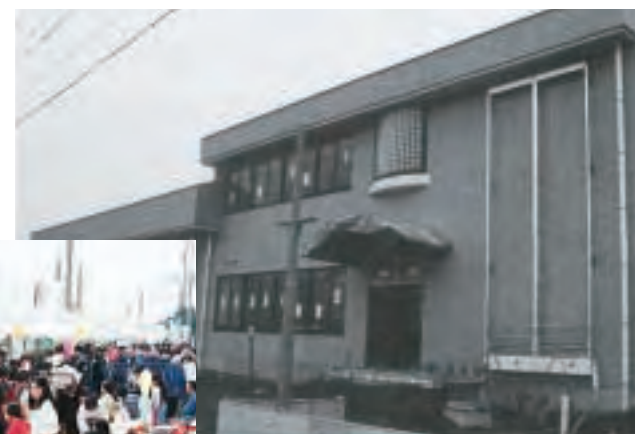
▲完成間近の消防分署(平成5年)