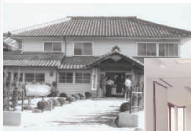
▲資料館展示・開館式 (昭和53年)