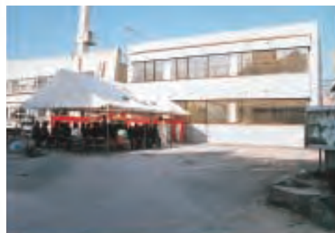
▲役場庁舎増築後(平成元年)