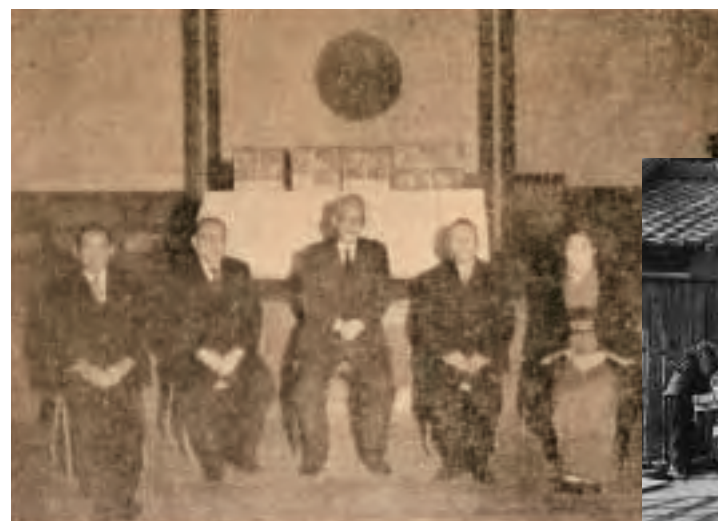
▲町功労者の表彰式(昭和35年)