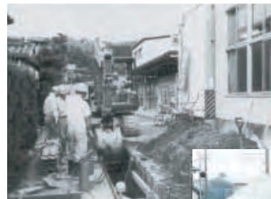
▲下水道埋設工事(平成4年)