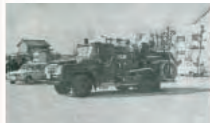
▲朝日町、川越町、合同消防出初式(昭和45年)