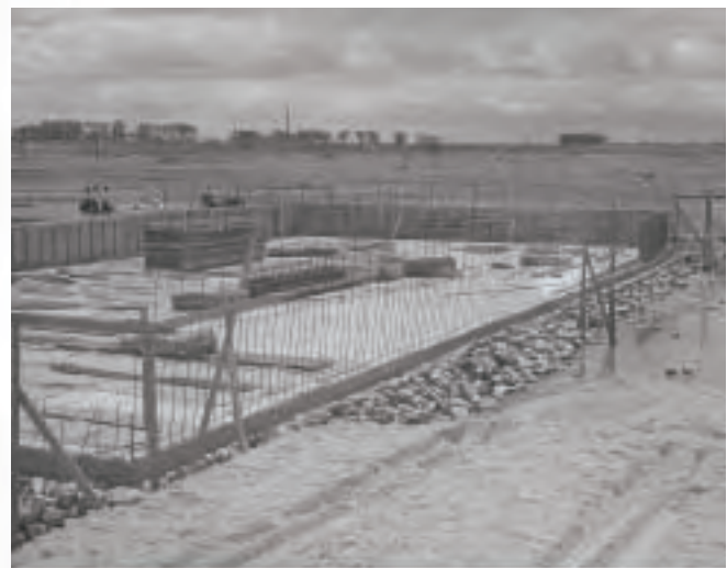
▲小学校プール着工(昭和31年)