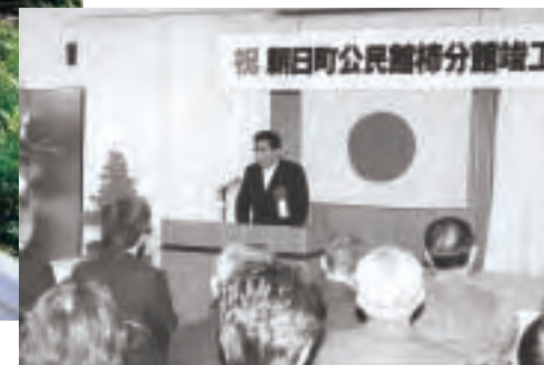
▲朝日町公民館柿分館竣工式(平成3年)