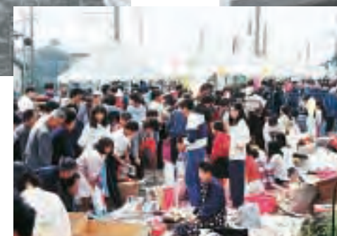
▲アサヒオープンフェスタ(平成5年)