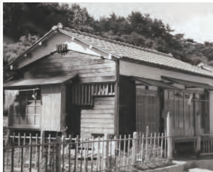
▲朝日ヶ丘町営住宅第2次建築(昭和29年)