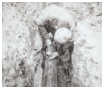
▲水道埋設工事(昭和29年)