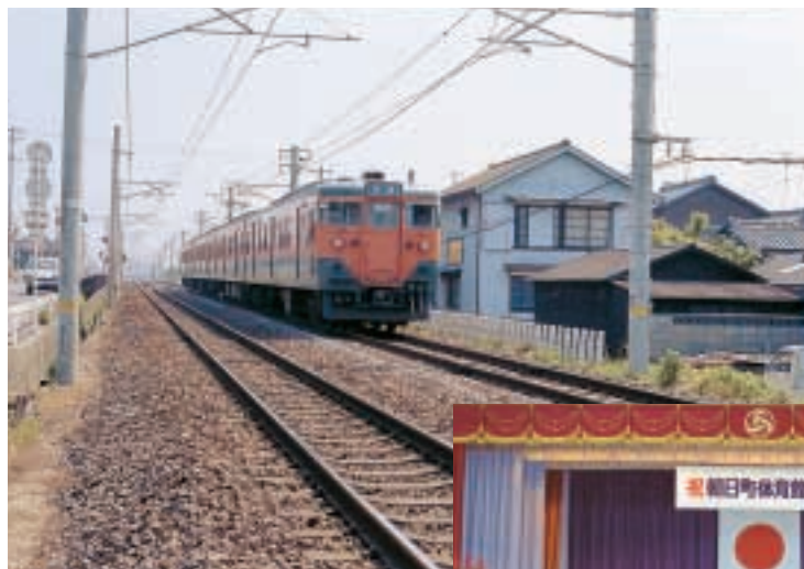
▲国鉄関西本線八田～亀山間電化 (昭和57年5月)