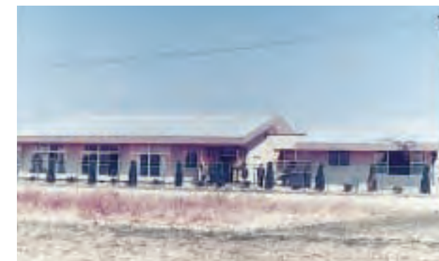
▲老人憩の家竣工(昭和49年)