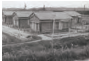
▲柿町営住宅10戸竣工(昭和30年)