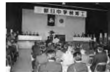
▲中学校竣工式(平成2年)