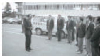
▲三重県知事来庁 (昭和56年)