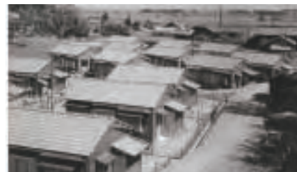
▲埋縄町営住宅15戸竣工(昭和32年11月)