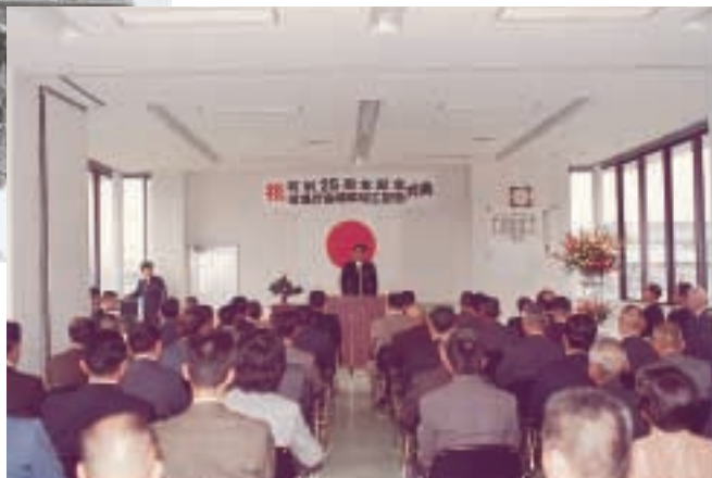
▲役場庁舎増築竣工式 (昭和54年)