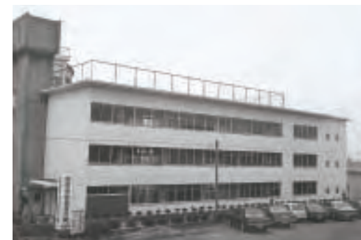
▲小学校西角形校舎増築竣工(昭和51年)