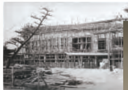
▲役場建設工事(昭和39年)