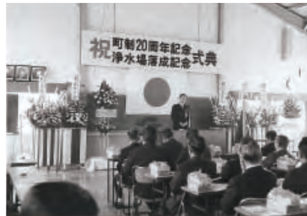
▲浄水場竣工式(昭和49年)