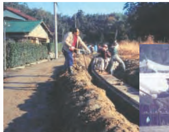
▲柿杜宅地区でボランティアによる側溝整備(昭和47年)