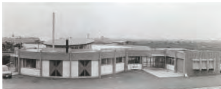
▲北保育園完成(昭和43年)