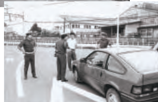
▲交通危険箇所調査(昭和62年)